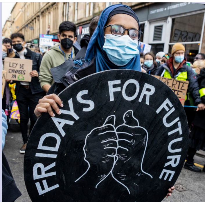
Strejk för klimatet i Glasgow, den 5 november 2021.