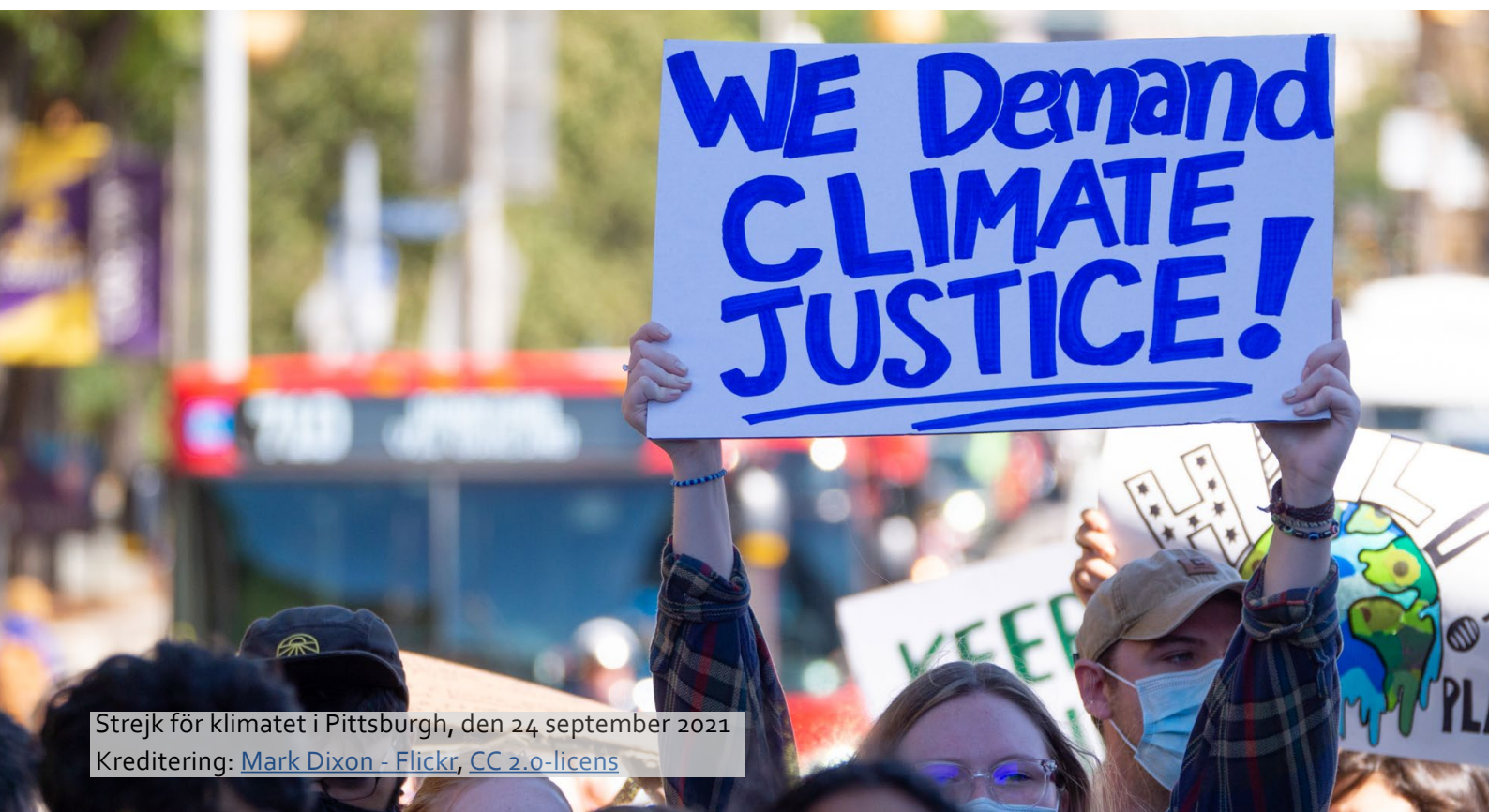
Strejk för klimatet i Pittsburgh, den 24 september 2021

Under klimatkatastrofer ökar kvinnors utsatthet och spridandet av sjukdomar, samtidigt som barnafödande blir mer riskfyllt med större risk för dödsfall för både mamman och barnet. Kvinnor spelar också en central roll som familjens primära vårdnadshavare och ser till att deras barn är trygga under kriser. När det blir ont om mat på grund av otillräcklig nederbörd offerar kvinnor ofta sin egen näring för att ge sina familjer mat. Kvinnor är också de som drabbas hårdast av vattenbrist och under torka måste de gå långt för att hitta rent vatten. Detta exponerar dem för ökade risker såsom sexuella övergrepp, trakasserier och människohandel. Den privata sfären är inte undantagen från faror, och antalet incidenter av könsbaserat våld, inklusive våld i hemmet, ökar kraftigt under klimatkatastrofer. Efterverkningarna av klimatrelaterade katastrofer tvingar också ofta kvinnor in i osäkra situationer. De flyr från översvämmade hem och söker skydd i informella bosättningar i städerna, ofta kallade slumområden, där de lever under osäkra och utsatta förhållanden. Kvinnors bristande tillgång till socialt, ekonomiskt och utbildningsmässigt kapital gör dem särskilt sårbara för det existentiella hot som klimatförändringarna utgör.